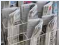
des journaux 新聞