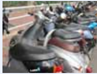
des scooters スクーター