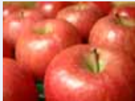
des pommes りんご