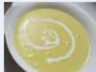
de la soupe スープ