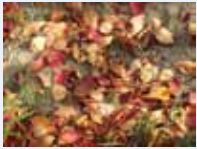
des feuilles 葉っぱ